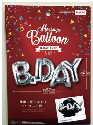
模倣品パッケージ

平素はアナグラムバルーンをご愛顧いただき、誠にありがとうございます。 さて、弊社がご提供させて頂いている米国アナグラム社製バルーンの模倣品がダイソー（株式会社大創産業）にて販売されていることを確認しました。 これを受けて、弊社より不正競争防止法の商品形態模倣行為に該当するとして販売の中止を申し入れました。ダイソー側はそれを受け入れ、商品の撤去ならびに販売中止を平成 29 年 12 月 15 日に通知してまいりました。